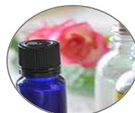
自分のためのブレンドオイル作り